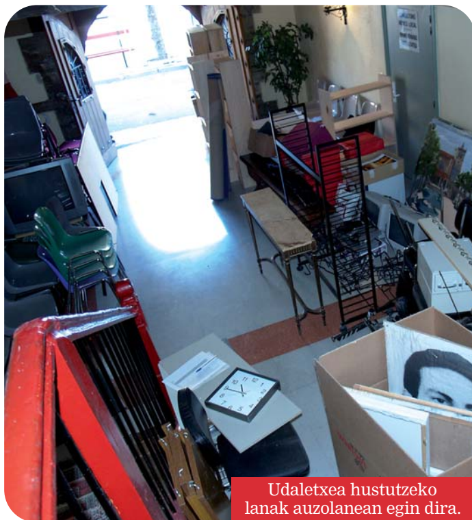
Udaletxea hustutzeko lanak auzolanean egin dira.