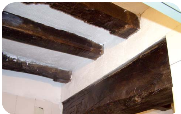
Medikuaren eta erizainaren geletako eta komuneko gelako sabai faltsuak kendu eta habeak agerian utzi dira, saneatzeko