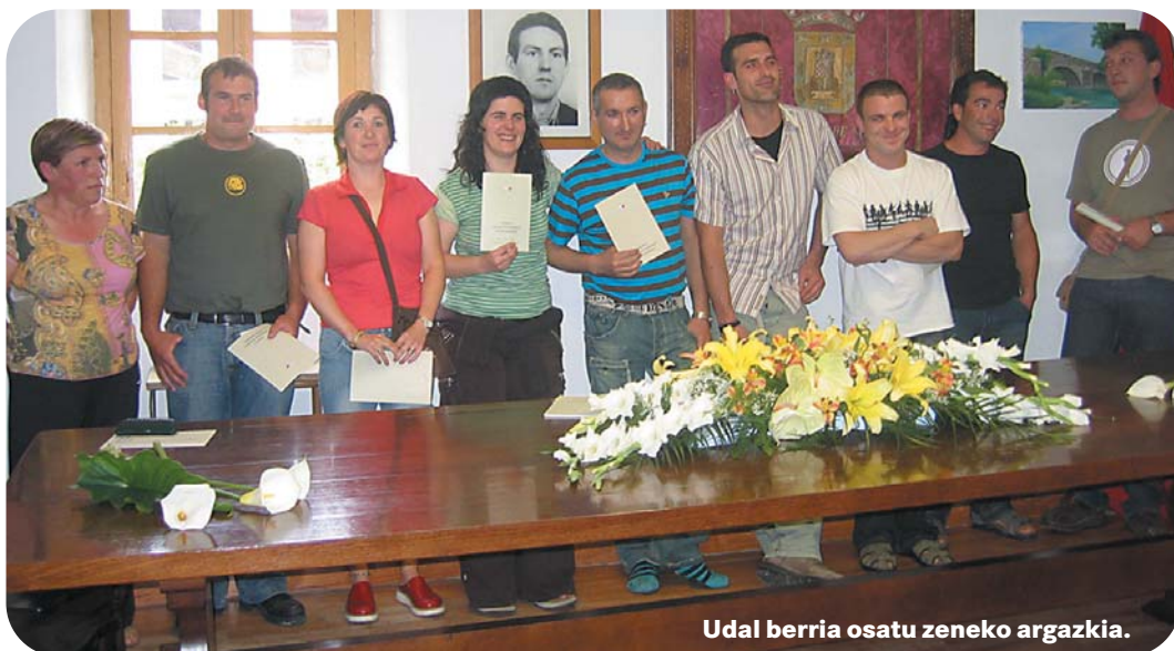
Udal berria osatu zeneko argazkia.