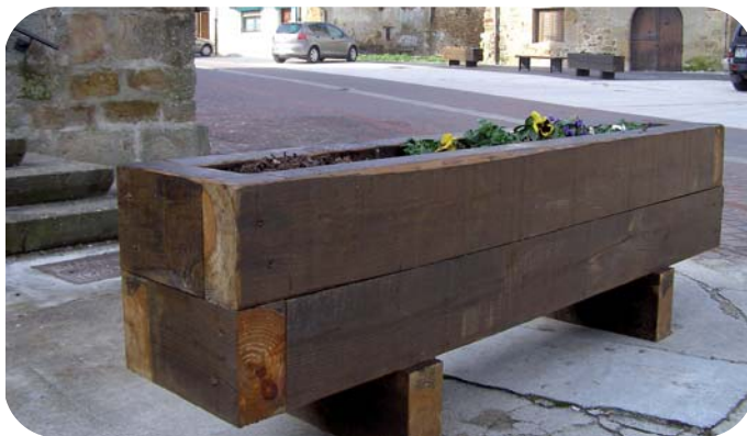
Kaleetan dauden 20 jardinerak auzolanean egin dira

Batetik, jardinerak prestatzeko hiru auzolan egin dira. Horietan parte hartu duten lakuntzarrek trabiesak mon-