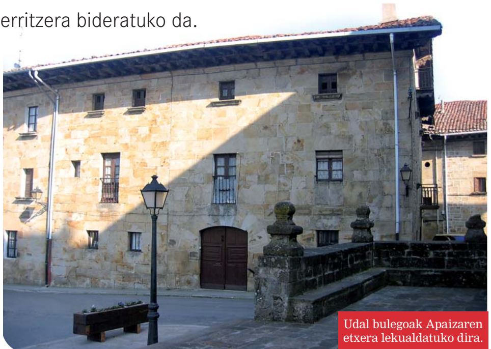
Udal bulegoak Apaizaren etxera lekualdatuko dira.

Ikastaroak maiatza arte jarraituko dute: pintura eta eskulanak ikastaroak eskola laboraletan egokituko den gela batera lekualdatuko dira eta lentzeria ikastaroak Kale Txiki tabernan jarraituko du.