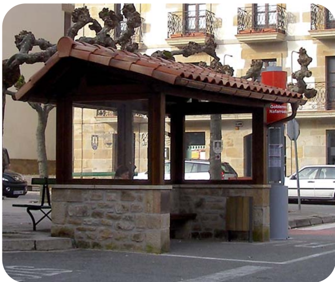
Markesinaren oinarria harrizkoa da eta pareta zurez eta kristalez osatuta dago.

Desde finales de octubre está en funcionamiento la nueva marquesina. Así las usuarias y usuarios del servicio de autobús ya tienen donde cobijarse mientras esperan al autobús. El presupuesto de la marquesina ha ascendido a 16.800 euros, de los que han recibido 12.500 euros de ayuda por parte del Gobierno de Navarra.