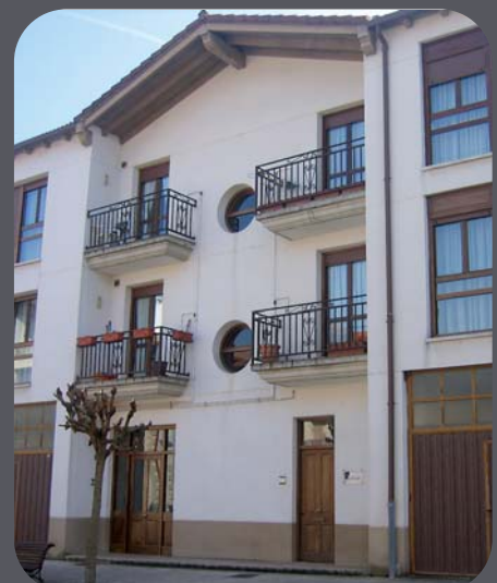
La consulta del médico estará en el nº 35 de Mikel Arregi

Así pues, los servicios que se ofrecían en la casa consistorial, cambiarán de ubicación. Las oficinas municipales pasarán a la Casa del Cura. La Asociación de Jubilados, al bar Kale Txiki. Las Oficinas de Correos al local situado detrás de la Caja Laboral. Los cursos de pintura y manualidades se impartirán en las Escuelas Laborales y lencería en el bar Kale Txiki. La biblioteca estará cerrada hasta la finalización de las obras.